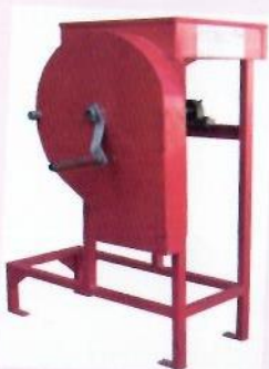
Kikerezo (Manual cassava chippers)