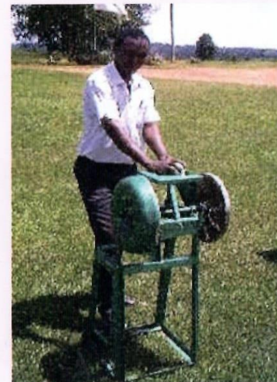
Kikerezo cha mkono