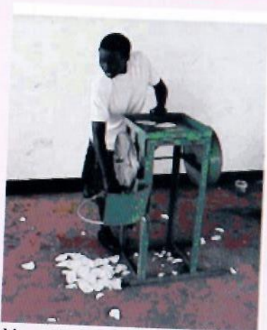
Mashine zaa kukereza Muhogo kwa mkono