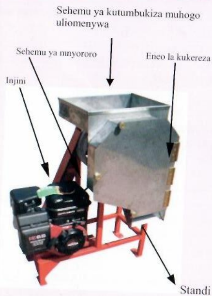
Mashine ya kukereza muhogo kutumia injini ikionyesha sehemu zake. (Chipper)