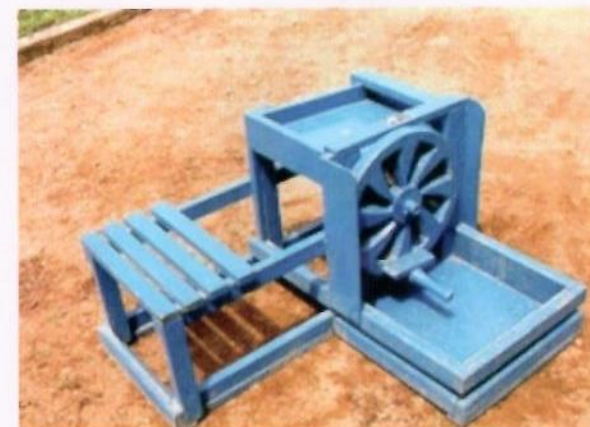
Mashine ya kukereza muhogo kwa mkono