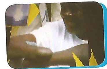
Mvuvi Aliyekatika Mikono Kutokana na Uvuvi Haramu wa Kutumia Mabomu

Athari nyingine zinazotokana na uvuvi haramu wa kutumia mabomu ni pamoja na mtumiaji wa mabomu hayo kupoteza baadhi ya viungo vya mwili wake au hata kupoteza uhai wake kabisa