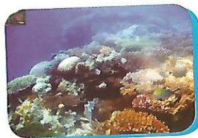
(A) Matumbawe ambayo hayajaharibiwa

Matumbawe ni moja ya viumbe waishio kwenye maji katika bahari. Matumbawe haya ni muhimu kwa ajili ya mazalia na makulio ya samaki. Vilevile matumbawe ni maeneo ambayo muhimu kwa ajili ya utalii ikolojia.