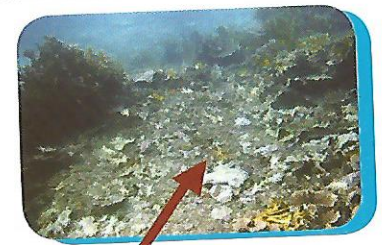
Matumbawe Yaliyoharibiwa na Bomu Yakionesha pia Kutokuwa na Samaki

Uoto wa matumbawe katika maeneo yaliyolipuliwa huharibika na mara nyingi hauoti tena na hivyo kuondoa mazalia na makulio ya samaki husika.