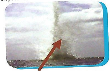
Mlipuko Wa Bomu na Matokeo Yake

Bomu linapolipuliwa kwenye maeneo ya matumbawe huathiri matumbawe, samaki na viumbe wengine wa baharini pamoja na eneo lililolipuliwa.