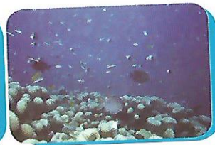
(B) Matumbawe ambayo hayajaharibiwa